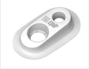
Artikel code 054117 DUSTER PRO STOFAFZUIGINGSADAPTER (10 ST)